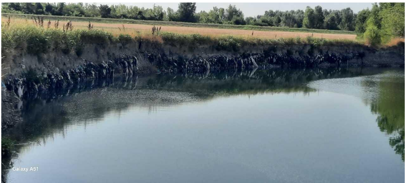
Foto 1 - fronte erosione con affioramento rifiuti